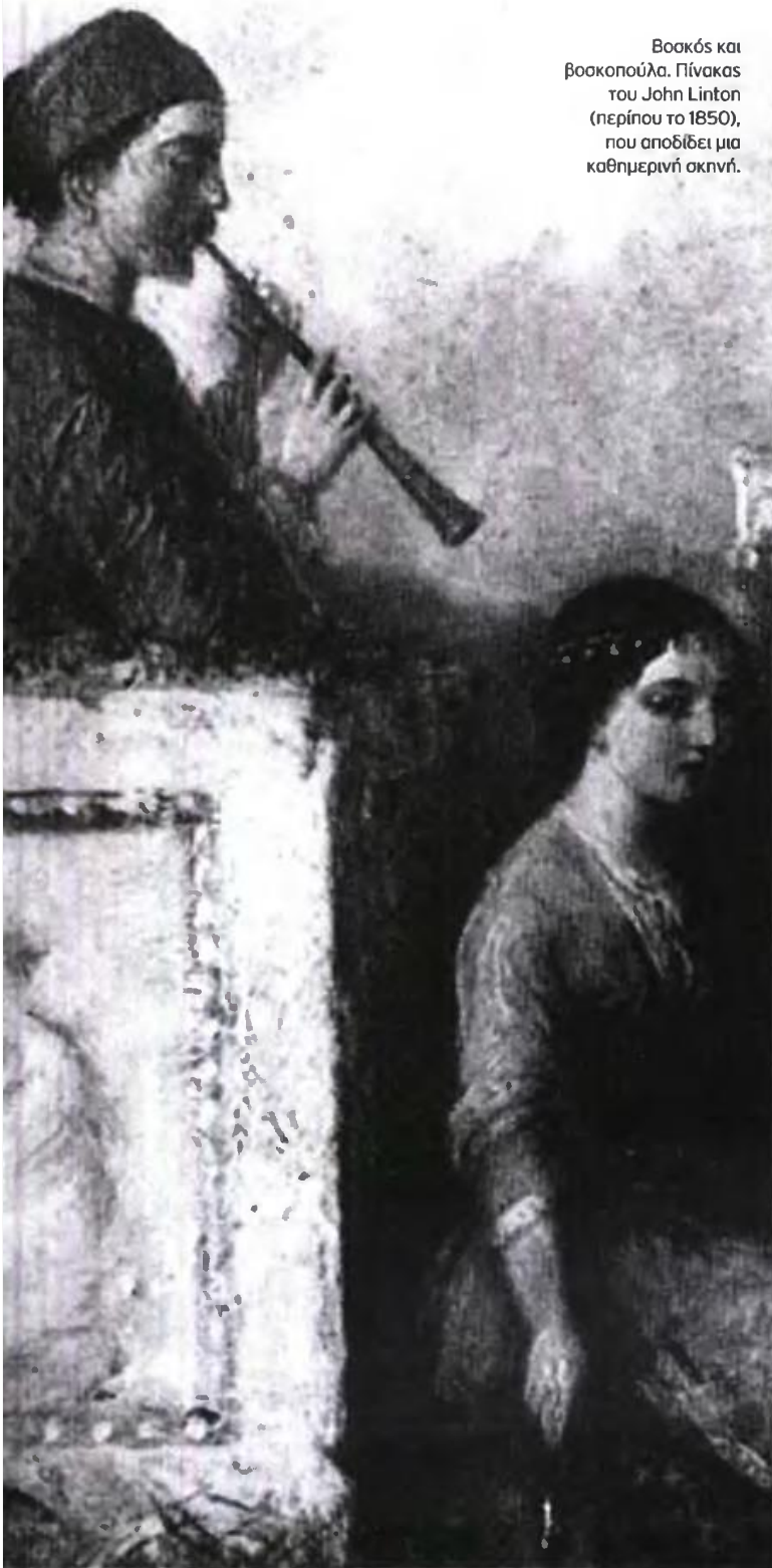
Βοσκός και βοσκοπούλα. Πίνακας του John Linton (περίπου το 1850), που αποδίδει μια καθημερινή σκηνή.

σουλτάνου είτε στο εξωτερικό. Αλλά και η αδυναμία τους να επιτύχουν αυτό τον στόχο σχεδιάζοντας έναν κοινό ορισμό και προβάλλοντας τα ίδια κριτήρια.