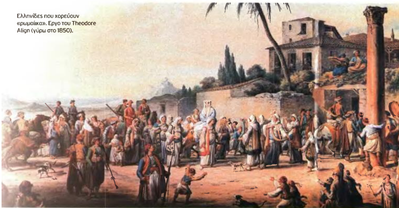
Ελληνίδες που χορεύουν «ρωμαίικα». Έργο του Theodore Align (γύρω στο 1850).